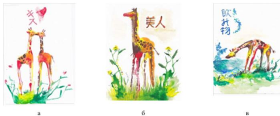
Рис. 2. Авторские эскизы принтов: а – «Поцелуй»; б – «Красавчик»; в – «Напиток»

Для дизайнера этот образ был очень важен, так как в современном мире значение поцелуя теряется (рис. 2а). Надпись соответственно переводится с японского как «поцелуй». Дизайнеру хотелось показать, что поцелуй не должен быть только частью «ритуала обольщения», а стать частью выражения подлинных чувств. Многие из современных молодых людей страдают эгоизмом и самолюбованием. Трансформируя эти негативные качества в образ жирафа и создав надпись на японском «красавчик», дизайнер хотел показать, что данные качества могут привести человека к плачевным последствиям. Ведь тонкие ноги жирафа как будто вот-вот рухнут (рис. 2б). При создании эскиза пьющего жирафа была использована естественная поза животного, нанесена надпись на японском «напиток» (рис. 2в).