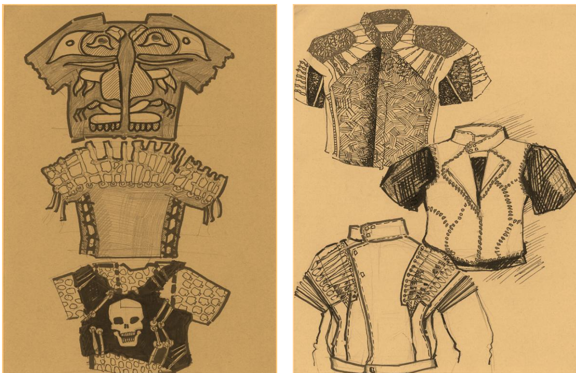
Рисунок 2- Эскизы проектируемой коллекции «Стальные мустанги»