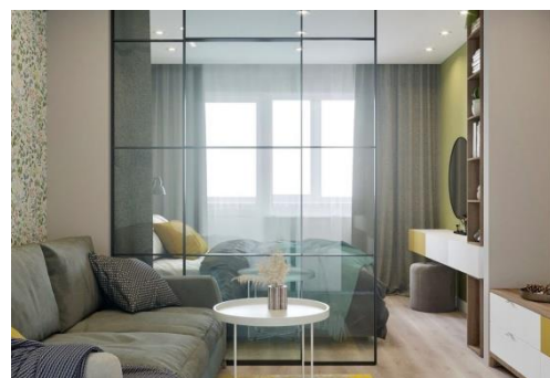
Рисунок 6 Дизайн квартиры в скандинавском эко-стиле в г. Владивостоке. Проект дизайн-студии «Созвездие» [5]

Заключение. После рассмотрения принципов формирования двух направлений эко-стиля: эко-минимализм, эко-шик, можно выявить их сходства и отличия.