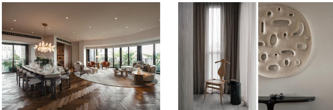
Рисунок 3. Проект Eden от Swire Properties, Сингапур [4]

Хотя создание экологически устойчивого дизайна интерьера является важным направлением в проектировании интерьеров, частота, с которой дизайнеры интерьеров делают выбор в пользу эко-дизайна в реальной практике, все еще ограничена, особенно там, где речь идет о подборе материалов для дизайнерских решений [10].