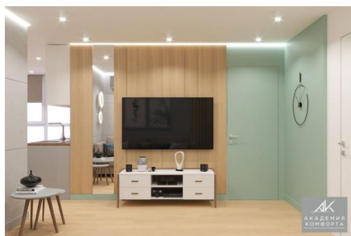
Рисунок 5 Дизайн 3-хкомнатной квартиры в эко-стиле в г. Владивостоке. Проект компании «Академия комфорта» [3]