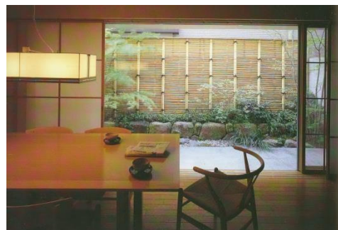
Рисунок 2. Интерьер дома в Киото в традиционном японском стиле. Дизайнер Yoshihiro Mashiko [10]

Основная идея стиля эко-шик заложена в самом названии. Под «эко» понимают экологическое качество материалов, используемых в проекте, в основном, натуральных природных материалов. «Шик» подразумевает создание шикарных, красивых, стильных интерьеров. Эко-шик – сегодня является дорогим удовольствием для потребителей, так как натуральные материалы (различные виды древесины, камня, кожи) стоят не дешево и все же более важным для потребителей является забота о здоровье. Экологическая чистота материалов, красота интерьеров, будут также направлены на психологический комфорт обитателей жилища.