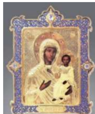
Рисунок 3. Фабрика Сазикова «Оклад для иконы»

Только в семидесятых и восьмидесятых годах 20-го века начинается новая волна интереса советских художников к богатым возможностям художественной эмали. Советские эмальеры получают возможность принимать участие в международных творческих семинарах сначала в Венгрии и Прибалтике, а затем и в других странах Западной Европы [5].