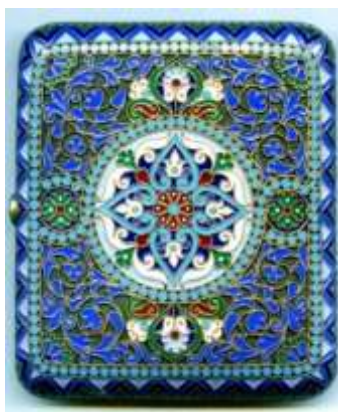
Рисунок 2. Овчинников «Царский Портсигар»