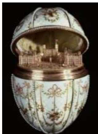
Рисунок 1. «Гатчинский дворец» Фаберже

пришла цветочная роспись на белом или цветном фоне, близкая к росписи по фарфору, а также советская символика и миниатюрная живопись на эмали в духе соцреализма. Позднее на базе ростовских артелей была организована фабрика «Ростовская финифть» [2],