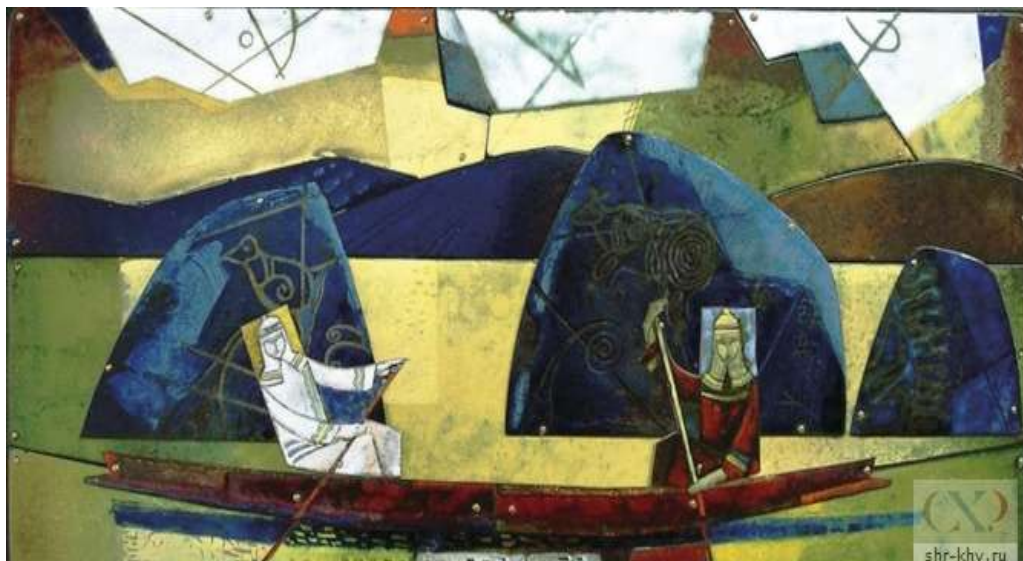
Рисунок.5 Конченков А.А. «Амур - река легенд». 2009 Медь, эмаль. 30 x 60

В настоящее время, в технике горячей эмали работают и молодые художники, выпускники Дальневосточной академии искусств (Рис.6)