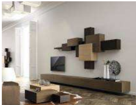
Рис. 2. Интерьер в стиле «Конструктивизм»