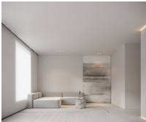
Рис. 1. Интерьер в стиле «Минимализм»

Стиль контемпорари появился во второй половине XX века. Это стилевое направление стало следствием комбинации нескольких течений: минимализма, конструктивизма и простоты скандинавских интерьеров (рис. 1, 2, 3). По настоящее время точной формулировки, чем этот стиль является, нет, строгих правил оформления – тем более. Контемпорари – тот стиль, который своим обликом передает подход к гармоничной и эстетичной организации пространства. Главное условие, чтобы в интерьере присутствовало единство элементов, а между задействованными стилями существовало компромиссное решение.