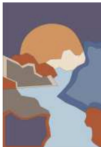
Рис. 5. Эскизное предложение «Закат»