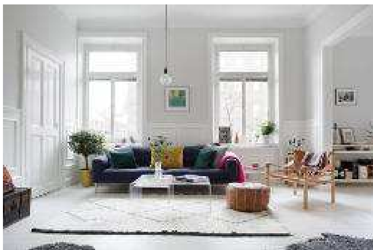
Рис. 3. Интерьер в скандинавском стиле

Стиль контемпорари нельзя назвать консервативным и окончательным, поскольку он подвержен влиянию времени и веянию моды. Например, если рассматривать запад, то «контемпорари» 50-х годов XX века был под воздействием минимализма. Основными чертами такого интерьера служили яркие цветовые акценты, а также минимальное количество вещей. В советский период 60-х годов прошлого века в моде была невысокая мебель на элегантных ножках, характерные и искусные очертания мебели. Изюминкой интерьера и настоящим предметом роскоши считались коллекции пластинок и редкие книги [2].