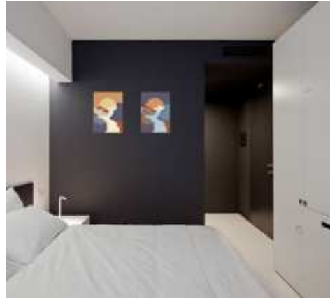
Рис. 7. Вариант размещения панно в интерьере