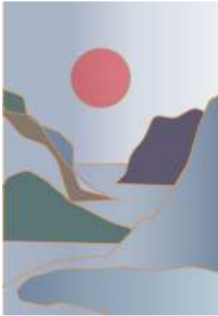
Рис. 6. Эскизное предложение «Морское молчание»