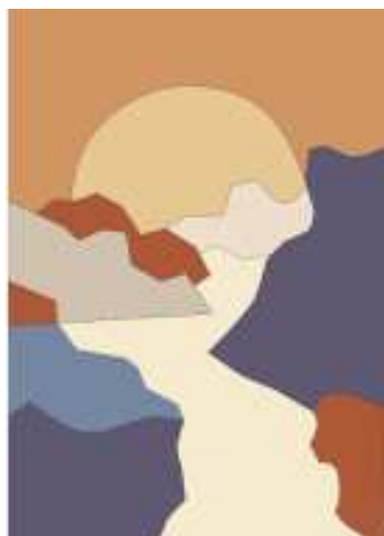
Рис. 4. Эскизное предложение «Рассвет»

Изделиями с художественной эмалью можно дополнить как мебель, так и использовать как отдельное панно, которое поставит неповторимый акцент в дизайне интерьера. Обустройство жилой среды превращается в творческий процесс, и кодом его нередко становится художественное произведение. В ходе исследования разработаны эскизные предложения и их воплощение в интерьере (рис. 4, 5, 6, 7, 8).